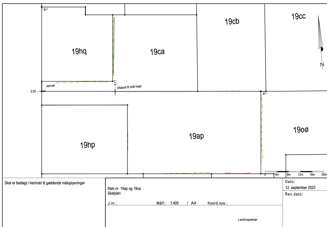
Figur 1: Udsnit af skelplan af 12. september 2022 fra Landinspektørfirma R.

Efter yderligere kontakt mellem B og Landinspektørfirma R orienterede firmaet hende den 17. november 2022 om, at fremtidige henvendelser ville blive faktureret.