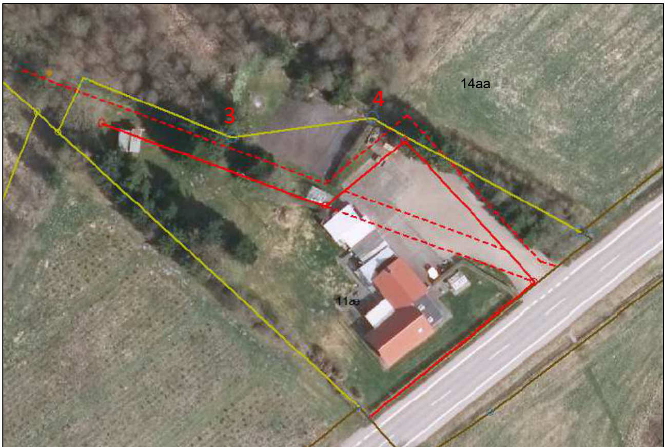
Figur nr. 4: Uddrag af skrivelse fra Geodatastyrelsen– suppleret med punktnr. fra måleblad.

Ved ejendomsberigtigelsen fik ejendommen matr.nr. 11æ ..., tillagt 852 m 2 af matr.nr. 14aa ..., som følge af hævd. Klagen angår den del af berigtigelsen, som går fra punktnr. 3 til 4 på målebladet, der i marken fremtræder som et blindt skel.