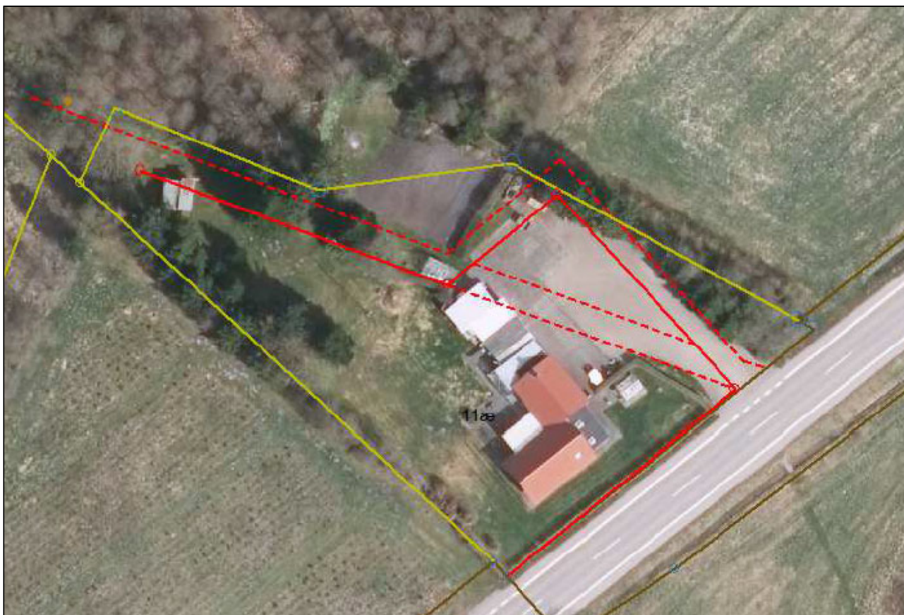
Figur nr. 3: Uddrag af skrivelse fra Geodatastyrelsen, skel som slettes er vist med rødt.