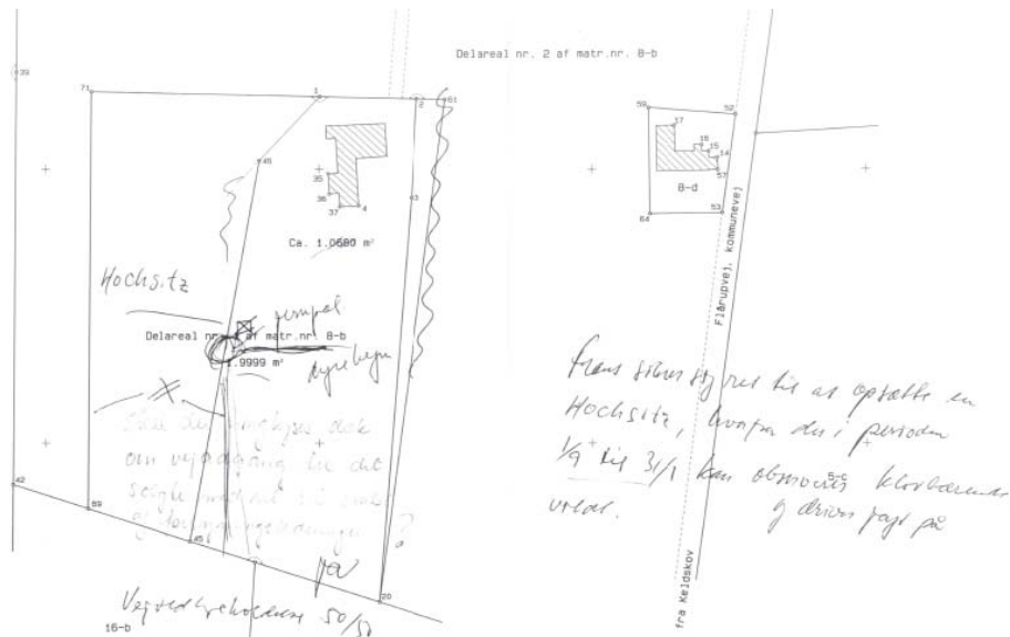
Fig. Den skitse, som landinspektør L udfærdigede i samråd med C på landinspektørens kontor umiddelbart efter den 19. juni 2007.

Endelig har jeg på intet tidspunkt afvist at lade sagen rette til efter parternes ønske. Blot måtte nogen betale herfor, men det ville ingen af parterne. Efter min opfattelse kan jeg principielt ikke vederlagsfrit lave sagen om, når dens indhold er udarbejdet helt i ovennævnt stemmelse med en så præcist beskrivelse af min opdragsgiver, og når den uden spørgsmål overhovedet fra køberne når at blive færdiggjort til indsendelse til notering ved Kort- og Matrikelstyrelsen”.