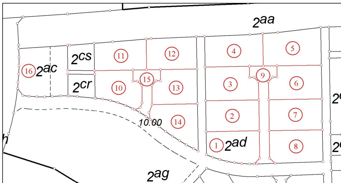
Figur 2: Udsnit af ændringskort af 20. oktober 2010 udarbejdet af Landinspektørfirmaet S

Landinspektør L har som led i Landinspektørnævnets behandling af klagen afgivet skriftlige bemærkninger til sagen og redegjort for sagsforløbet.